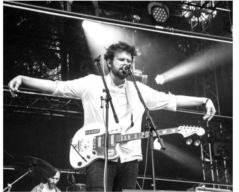
Per tris dienas festivalyje „Devilstone“ pasirodymus surengė per pusę šimto muzikos kolektyvų.

Toje pačioje scenoje taip pat surengtas ir performansas su tapyba ant kūnų. Kolektyvas „LunArctic“ pristatė meninį šou „Ritualai“, kurio metu scenoje plaukštėsi tik apatinės kelnaitės