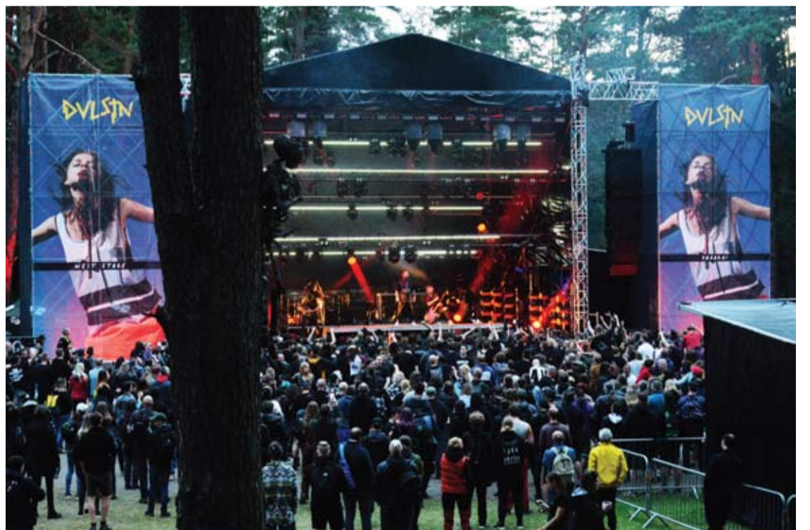
Vakarų scenoje dažniausiai skambėjo metalo muzika.

nesantaikos kurstymo kreipėsi į teisėsaugininkus. Tačiau tikinčiuosius suerzino apverstas kruvinas kryžius, niekinami liturginiai rūbai, pasirodyme naudota kiaulės galva.